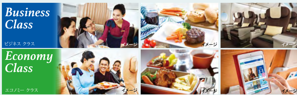
※上記フライトスケジュールは2019年11月現在のものです。 ※フライトスケジュール及び使用機材は予告なしに変更される場合がございます。

こだわりの機内食や、ワイヤレス機内エンターテインメントシステム「シルクエアスタジオ」、無料受託手荷物、スルーチェックインなど、フルサービス。航空会社ならではの快適な空の旅をお楽しみください。