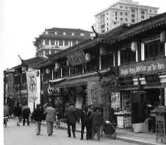
Shanghai Old Street 上海老街

●旅行出発の5日前までに日本にてお申し込み下さい。●取消料がかかる場合がございますので、申込みの際にご確認下さい。●各オプションツアーは現地旅行会社の主催となります。●所要時間はホテル出発から帰着までの移動時間も含まれます。又、交通事情や受入機関の事情により変更になる場合がございます。